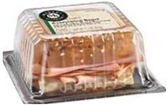
Market Sandwich – Everything bagel 1S9099,1S9252,1S9268