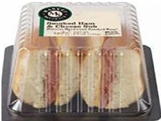
Market Sandwich – Smoked ham and cheese sub 1S9081,1S9099